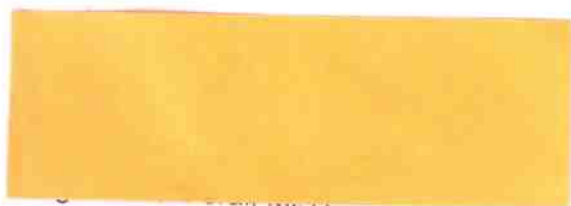
predseda Predstavenstva Všeobecnej zdravotnej poisťovne, a.s.